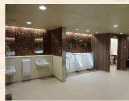
新大阪地下鉄トイレ男子内装（第一回日本トイレ大賞受賞）