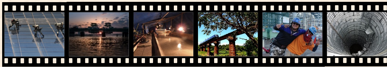
インフラフォトコンテスト 応募作品