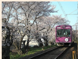
京都・嵐電車両色彩は「京紫色」に変わった