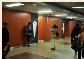
大阪市市営地下鉄トイレリニューアルサイン