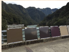
橋梁の色彩決定のためのサンプル検討