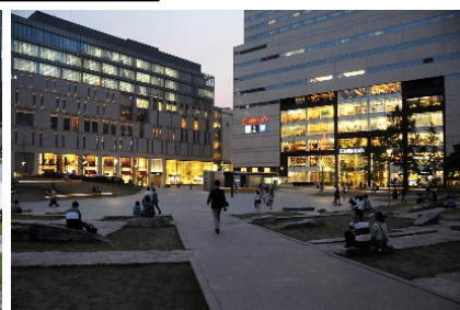
周辺ビルへの波及効果が確認