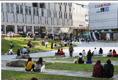
賑わいを取り戻した警固公園

警固公園はかつて死角の多さから夜間の犯罪や騒音被害等が相次いでいた。これを受け、本事業では単に見通しを良くする防犯対策のみならず、周囲の景観や賑わいを考慮したデザイン提案がなされ、その結果、治安改善とともに人通りの増加、園内における利用者動線の広がり等に繋がった。