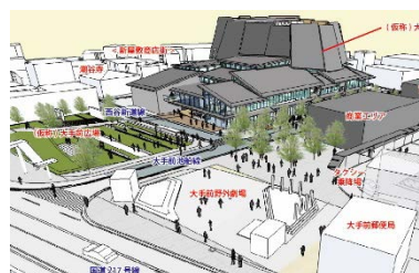
大分県佐伯市大手前地区開発