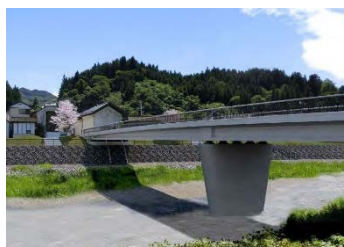
岩手県住田町昭和橋設計