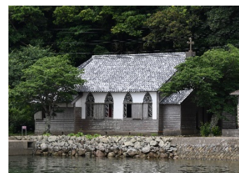
長崎県五島市景観整備

美しい宮崎づくり推進室ではFacebook及びYouTubeチャンネルを開設しています！活動団体の取り組みやイベント情報などを掲載していますのでぜひご覧ください！