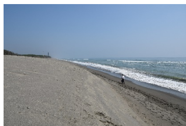
宮崎海岸侵食対策事業