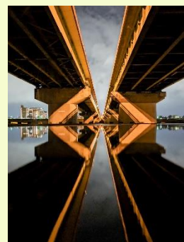
最優秀賞（高校生以下の部）